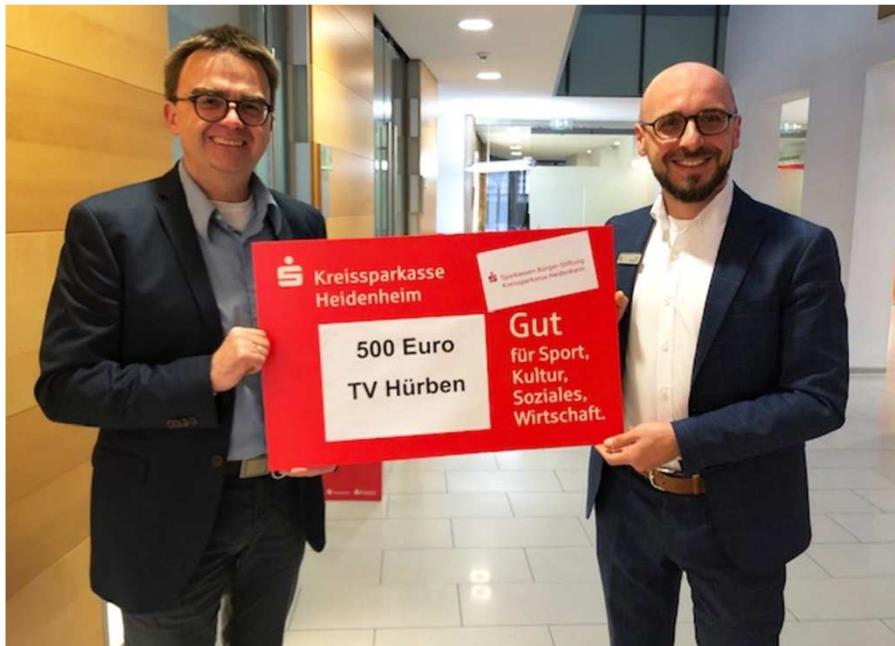
Spendenempfänger: TV Hürben