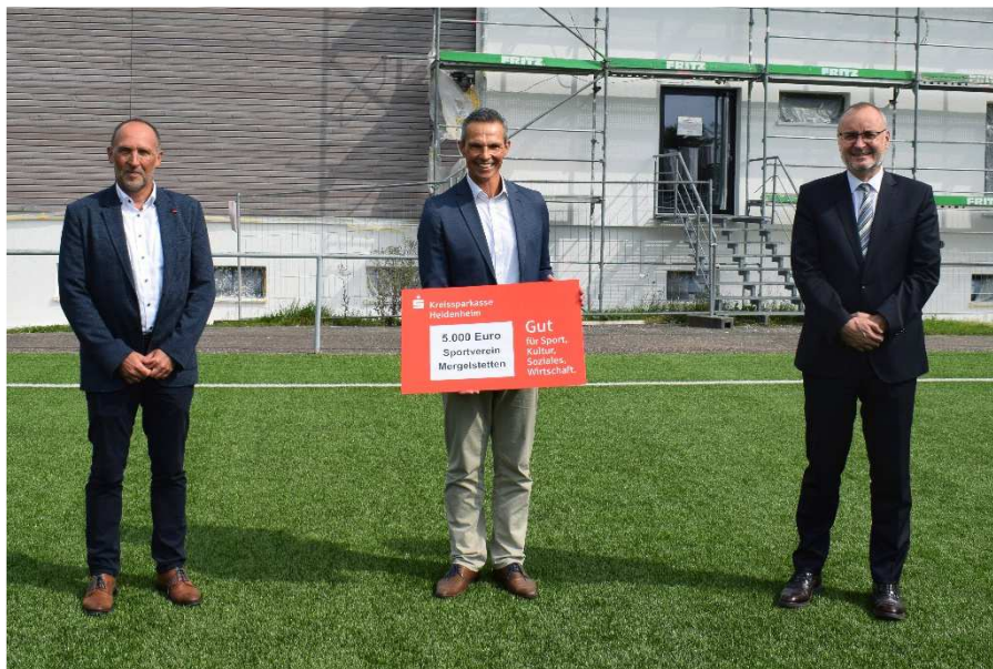
Spendenempfänger: Sportverein Mergelstetten