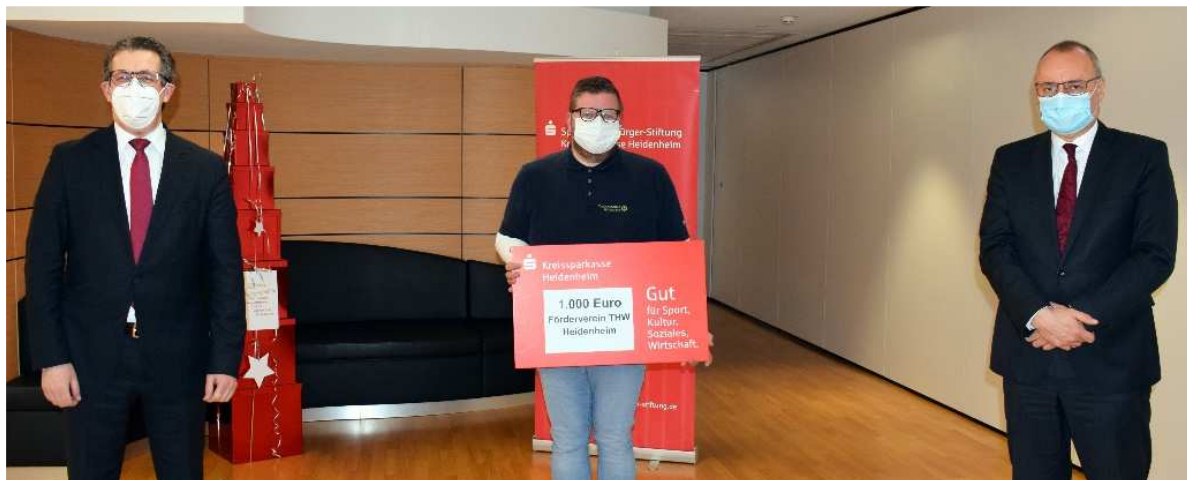
Spendenempfänger: Förderverein THW Heidenheim