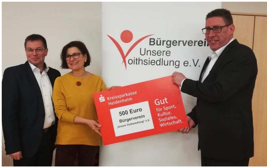
Spendenempfänger: Bürgerverein „Unsere Voithsiedlung“ e.V.