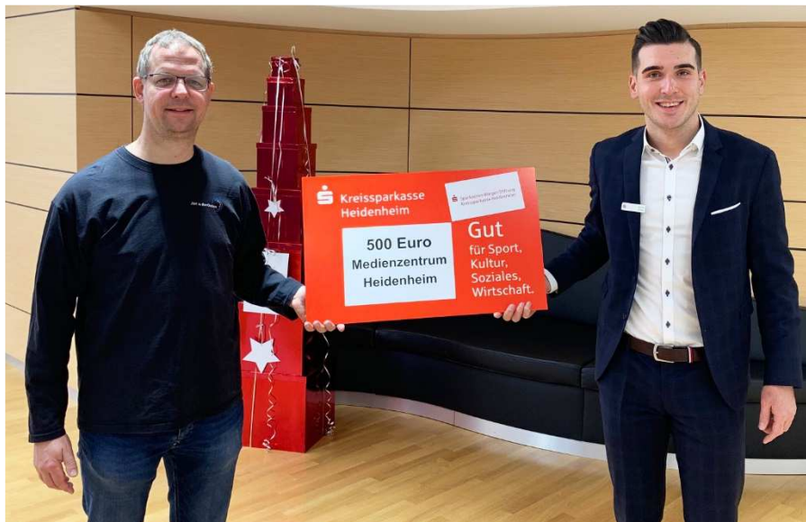
Spendenempfänger: Medienzentrum Heidenheim