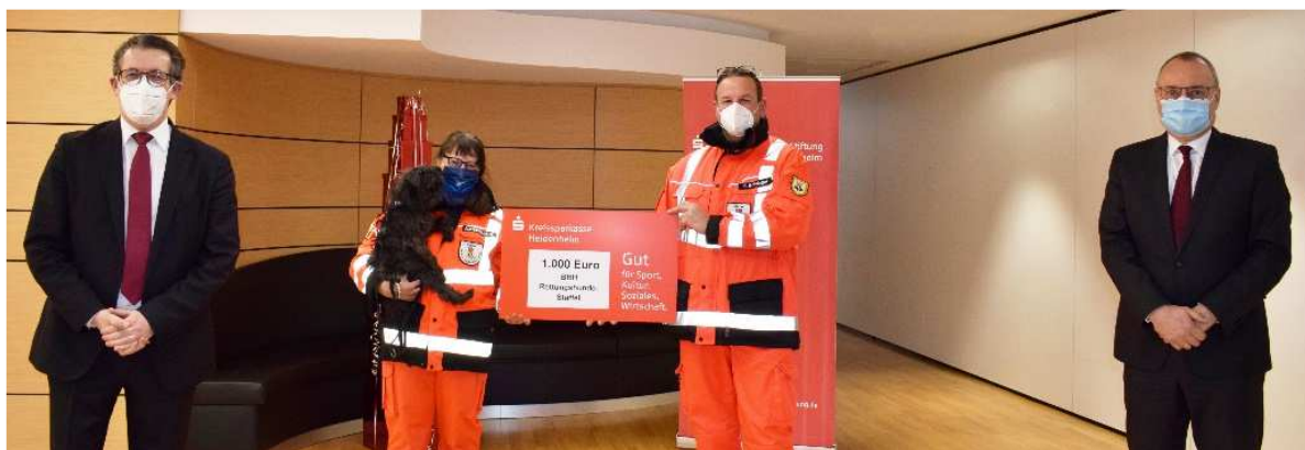
Spendenempfänger: BRH Rettungshundestaffel