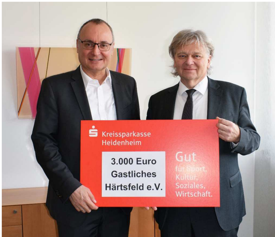
Spendenempfänger: Gastliches Härtsfeld e.V.