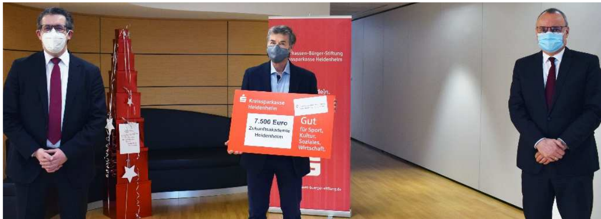
Spendenempfänger: Zukunftsakademie Heidenheim e.V.